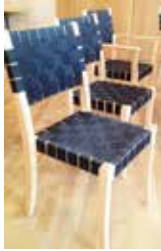
De nya stolarna.

Om du besökt församlingssalen de senaste veckorna så har du kanske upptäckt att den utrustats med nya stolar. Numera står där vackra stolar från Sveriges äldsta möbelfabrik, Gemla i Småland. Den här stolsmodellen är en riktig kvalitetsmöbel som vi hoppas ska hålla i många år framöver. Men visste du att våra nya stolar är begagnade? Faktum är att vi gjorde ett riktigt second handfynd när vi hittade dem. Så vi har inte bara fått nya, fina stolar; vi har samtidigt gjort en god gärning för vår miljö genom att återbruka möbler istället för att köpa nya.