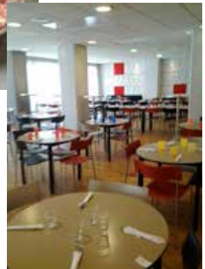
Bilder från lunchen i Immanuelskyrkan 3 maj.